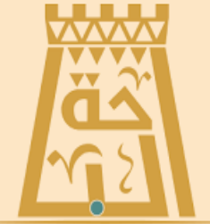
أمانة الباحة ALBAHA MUNICIPALITY