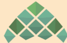
أمانة منطقة جازان