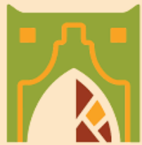
أمانة نجران NAJRAN MUNICIPALITY