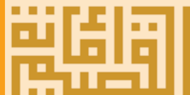
أمانة منطقة القصيم